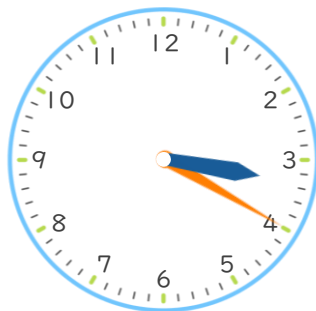
よみ終わった時こく