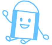
好きな給食のメニュー