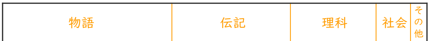
学級文庫の数と割合