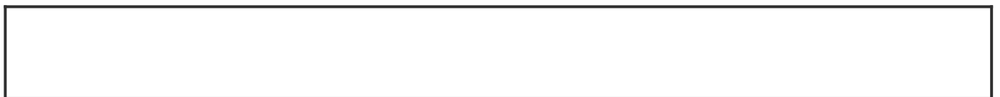
野菜の種類別の畑の面積