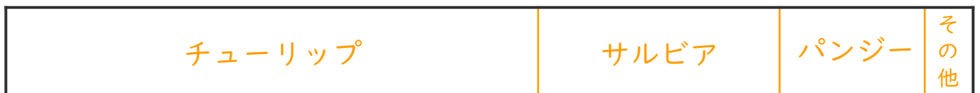
花だんの花別の面積と割合