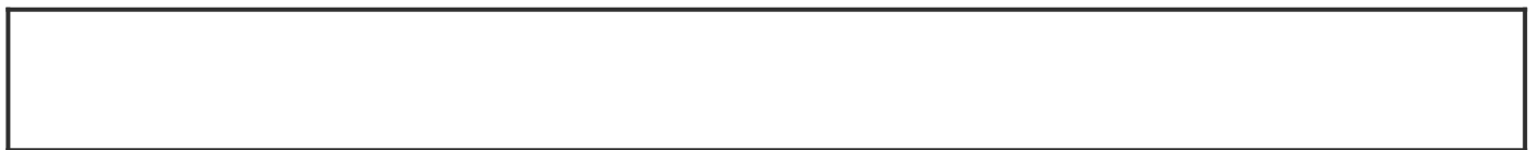
果樹園の種類別の面積