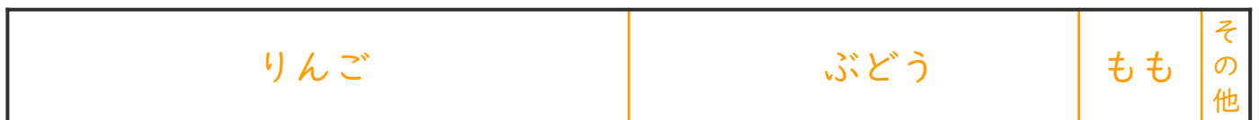
果樹園の種類別の面積