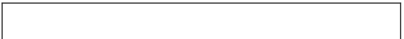
果樹園の種類別の面積