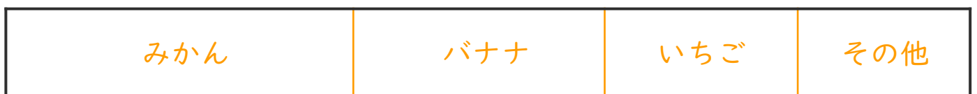
5年生の好きな果物